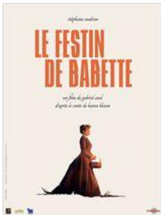
1987 – Drame avec Stephane Audran, Bodil Kjer et Birgitte Federspiel

Après avoir quitté l'armée, Brian Flanagan essaie de se trouver un boulot à New-York, mais il n'a aucun diplôme. Il décide d'entamer des études tout en étant serveur dans un bar. La solution de facilité, pense-t-il. Mais ce boulot n'est pas aussi facile qu'il le pense. Le patron, Douglas Koglan, décide de lui apprendre tous les « trucs » : les façons de servir, les astuces de consommation, etc. En peu de temps, Brian devient